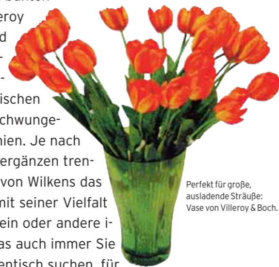
Perfekt für große, ausladende Sträuße: Vase von Villeroy & Boch.